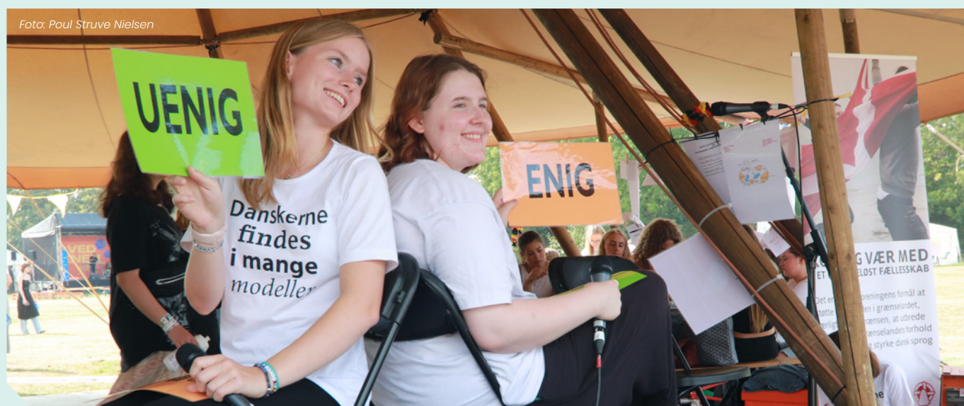
Elevambassadørerne til folkemøde i gang med en aktivitet, hvor eleverne på scenen og publikum skulle forholde sig til forskellige spørgsmål om europæisk identitet.