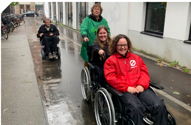
Tour on Wheels giver gående muligheden for at opleve Aarhus' gader fra en kørestolsbrugers perspektiv.