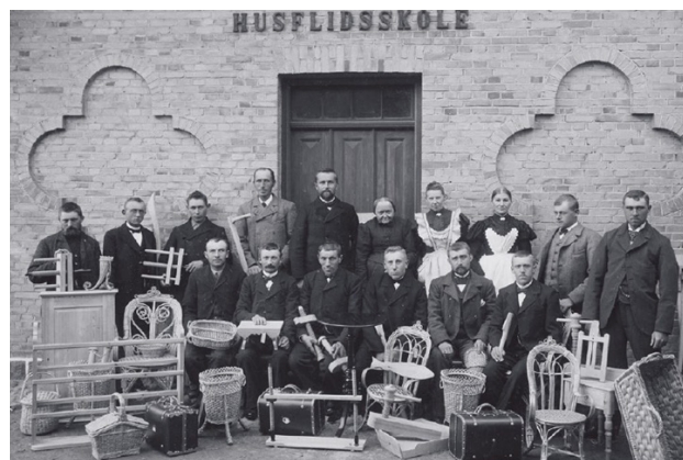
På billedet ses kursister fra lærerkurset på Melby Efterskole ved Kalundborg i 1899, der stolte fremviser deres husflidsarbejder, hvoraf mange i dag findes i den historiske samling.

Fonden for Husflid og Håndarbejde har længe kæmpet for at finde et nyt hjem til deres 150-år gamle husflidssamling, der ellers var i fare for at lide døden. Men nu har Nationalmuseet takket ja til at modtage en stor del af den historiske samling, der spænder fra perioden 1870 frem til ca. 1950. Udover den del af samlingen, der nu går til Nationalmuseet, er andre dele af samlingen bredt ud til andre modtagere og findes nu blandt andet på Frilandsmuseet, Holbæk Museum og Rigsarkivet.