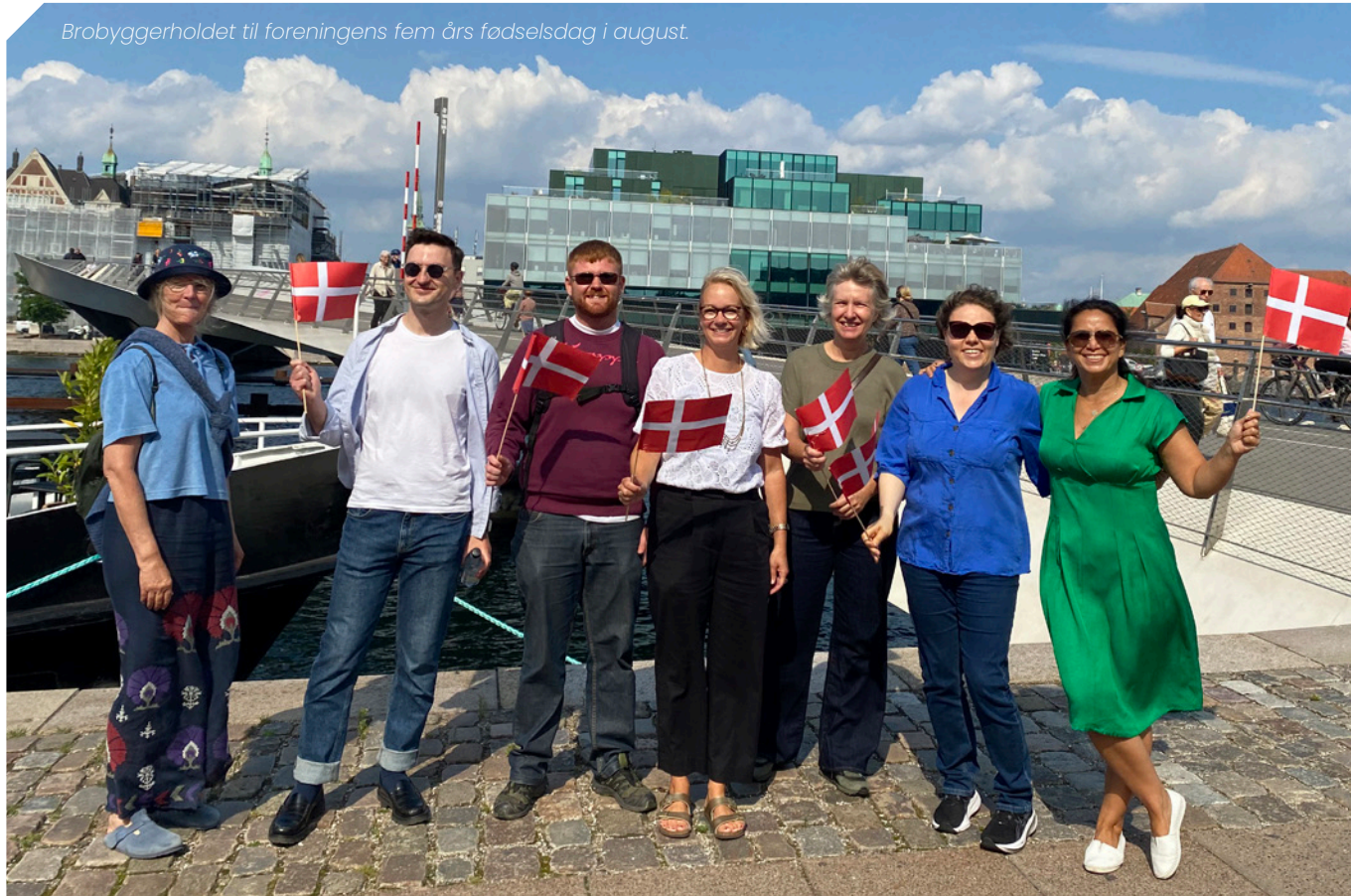
Brobyggerholdet til foreningens fem års fødselsdag i august.

Nogle gange kører man over broen og opdager, at solen skinner mere på den anden side, eller man finder kærligheden derovre. Andre gange bliver man bekræftet i, at byen man kom fra, var meget bedre. Men der er jo altid en lille risiko for, at man ikke har ret. At verden ser lidt mere nuanceret ud på den anden side, at der var nogle blinde vinkler, man ikke havde set. Enten kan vi blive klogere sammen, ellers kan vi blive bekræftet i de værdier vi har. Begge dele er okay. Succeskriteriet for brobygning er ikke enighed, men en større tolerance for forskellighed.” Det er dog sværere, end det lyder.