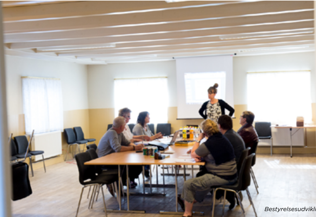
Bestyrelsesudvikling hos Midtfyns Husflid