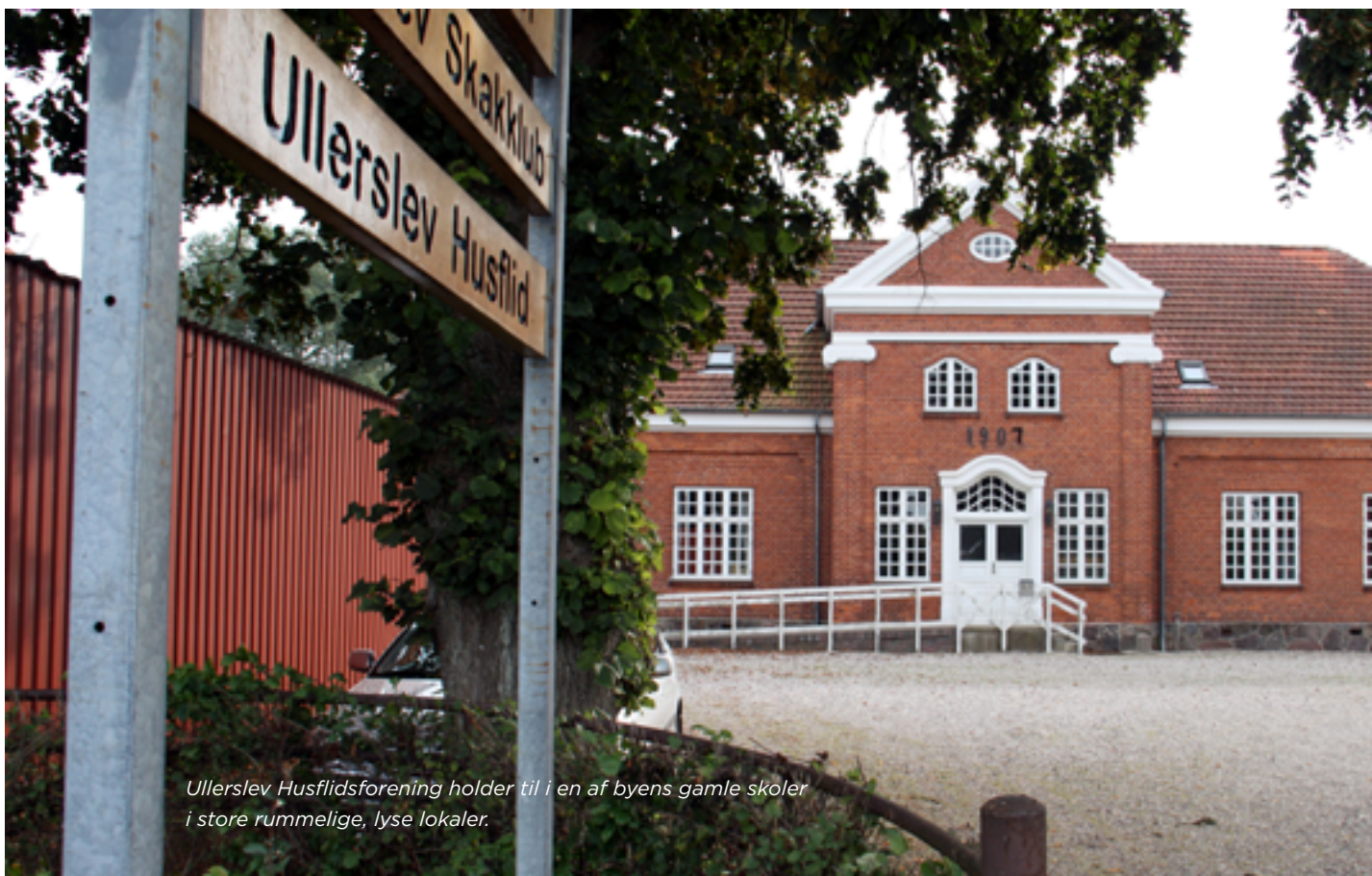
Ullerslev Husflidsforening holder til i en af byens gamle skoler i store rummelige, lyse lokaler.