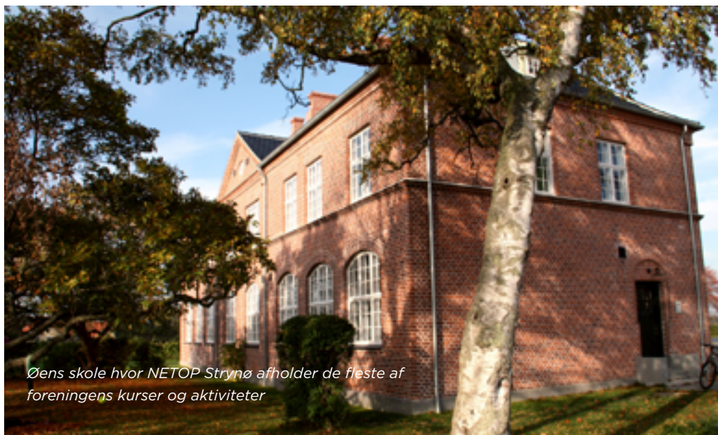
Øens skole hvor NETOP Strynø afholder de fleste af foreningens kurser og aktiviteter