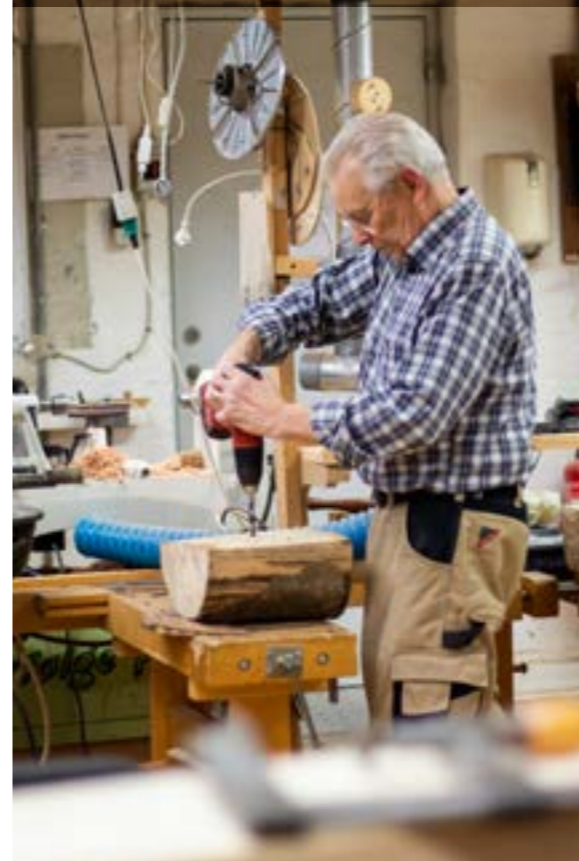
En deltager er ved at lave en trappe til hjemmet