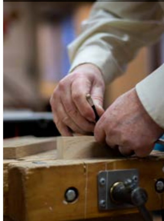
På de fleste af holdene hos Herfølge Husflid arbejder de med træ

Så kan det give mening at starte der, hvor de i Herfølge Husflid fandt ud af, hvad deres forenings gennemsnitsalder var. Synes I, den er for høj? Gå så videre til snakken i bestyrelsen: Hvilken målgruppe kunne I godt tænke jer at se flere af i foreningen? Og kast til sidst et blik rundt i foreningen: Er der personer i jeres medlemsskare eller bestyrelse, som har evner og interesser, som endnu ikke er kommet i spil i foreningen? Kunne det blive et afsæt for et nyt projekt, kursus eller aktivitet i jeres forening, som kunne tiltrække den målgruppe, I gerne vil se mere til i foreningen?