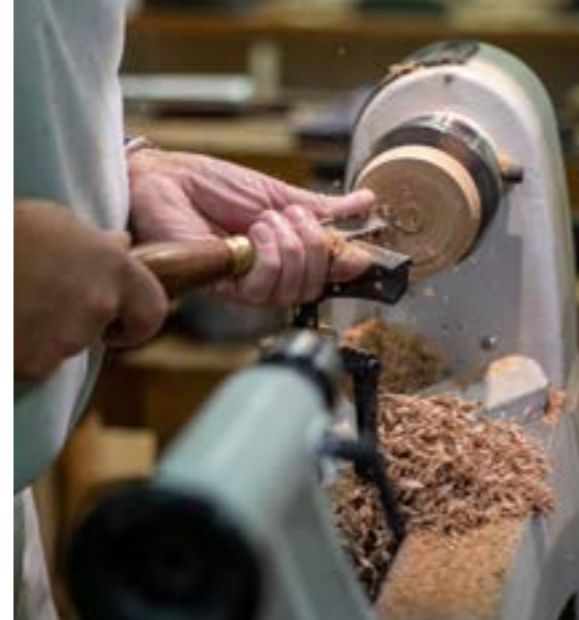
For WD er det vigtigt, at der er et sted som dette, hvor man kan komme og dyrke sine interesser i fællesskab med andre