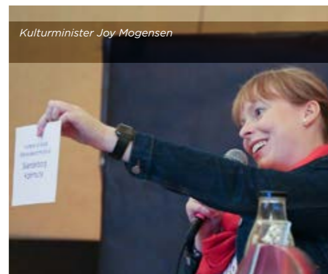
Kulturminister Joy Mogensen