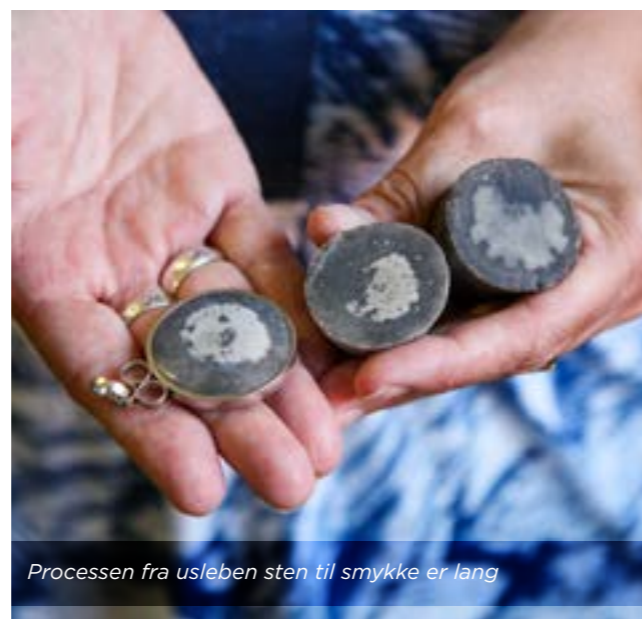
Processen fra usleben sten til smykke er lang