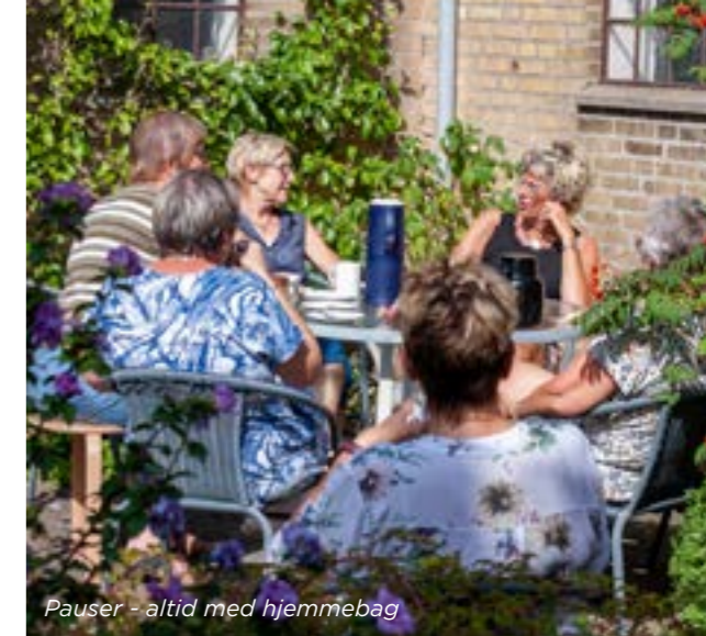
Pauser - altid med hjemmebag