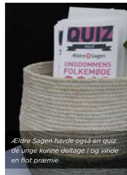
Ældre Sagen havde også en quiz de unge kunne deltage i og vinde en flot præmie

I Ældre Sagen går generationsmødearbejdet eksempelvis ud på, at en ældre kommer ud i en børnehave og samarbejder med pædagogerne i formiddagstimer, og agerer en ekstra voksen, der