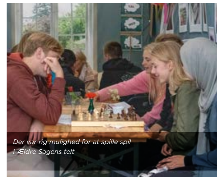
Der var rig mulighed for at spille spil i Ældre Sagens telt