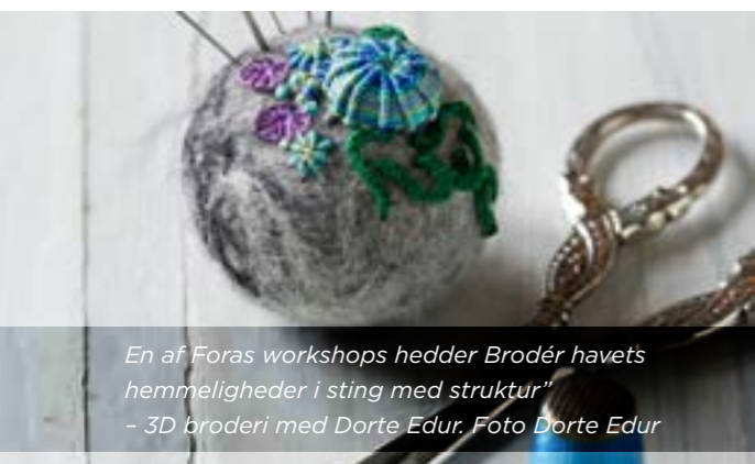
En af Foras workshops hedder Brodér havets hemmeligheder i sting med struktur" - 3D broderi med Dorte Edur.

Fora Fagkursus udbyder en ny workshop på messen hver dag. Det betyder, at der i hvert fald vil være tre forskellige emner, de besøgende kan deltage i. Det bliver "Filt små dyr", "Træskeer/brug kniven godt" og "3D - broderi". Fora Fagkursus' workshops tilbydes som "drop-in"-workshops, og det er gratis at deltage. ■