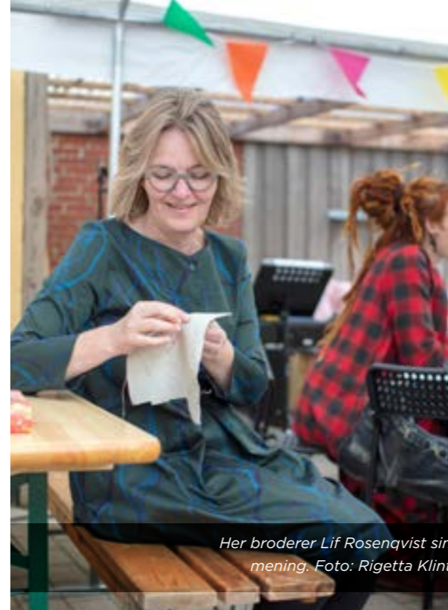
Her broderer Lif Rosenqvist sin mening.

Læs mere på side 16 om Aftenskolernes Pris Læs mere på side 18 om Foras musikalske debat, som satte fokus på daghøjskolerne og uddannelsens biveje