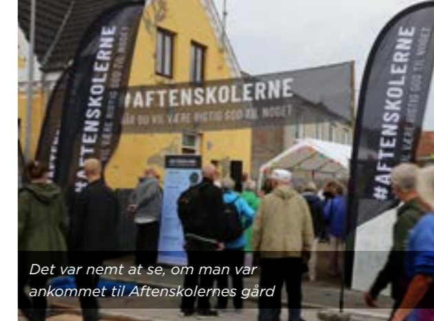
Det var nemt at se, om man var ankommet til Aftenskolernes gård