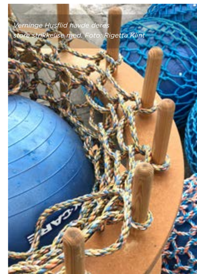
Verninge Husflid havde deres store strikkelse med.