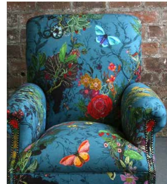
Foto af den populære stol, som fik over 68.000 likes. Foto fra Folt Bolt Facebookside. Ophav: TIMOROUS BEASTIES