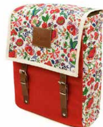
En af de mange kreationer, der deles på Folt Bolt. Her af designeren Modernaked