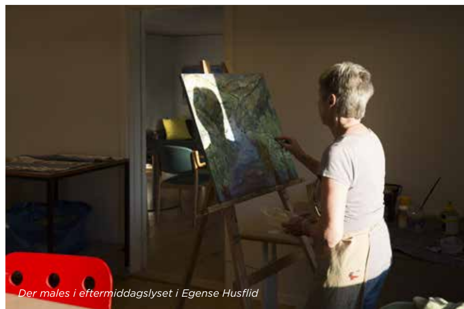
Der males i eftermiddagslyset i Egense Husflid