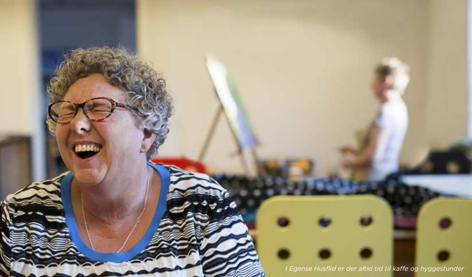
I Egense Husflid er der altid tid til kaffe og hyggestunder