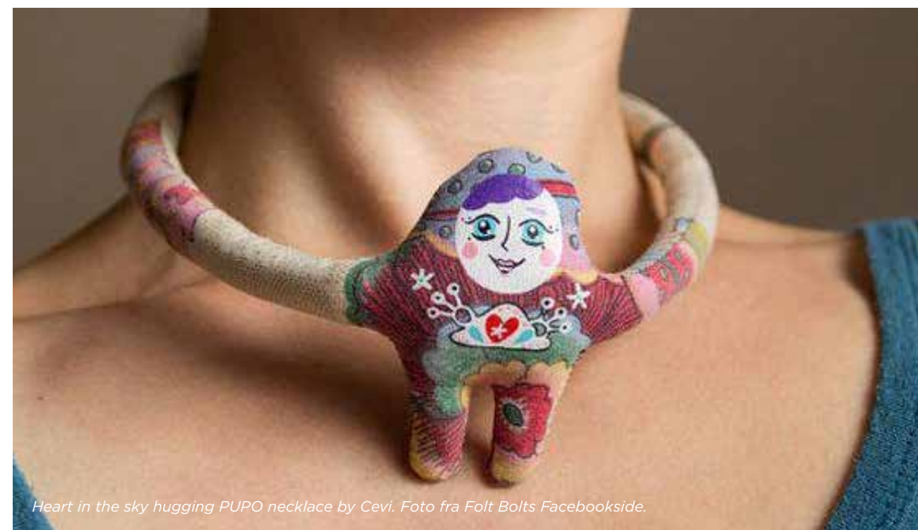
Heart in the sky hugging PUPPO necklace by Cevi.