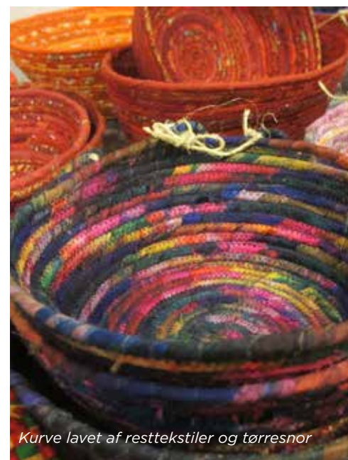
Kurve lavet af resttekstiler og tørresnor