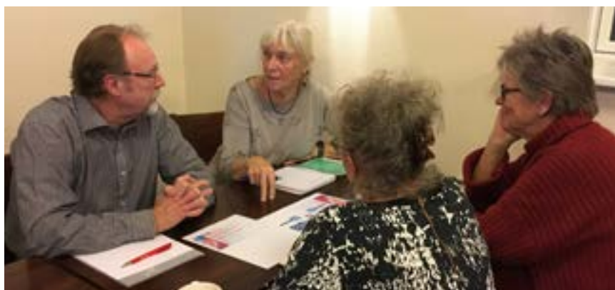
Fora har afholdt en række fyraftensmøder i hele landet, hvor fokus har været på rekruttering og generationsskifte.

HVAD skal personen egentlig lave eller være med til? Hvis det er en bestyrelsespost er det rigtig godt at kunne sige, hvad I