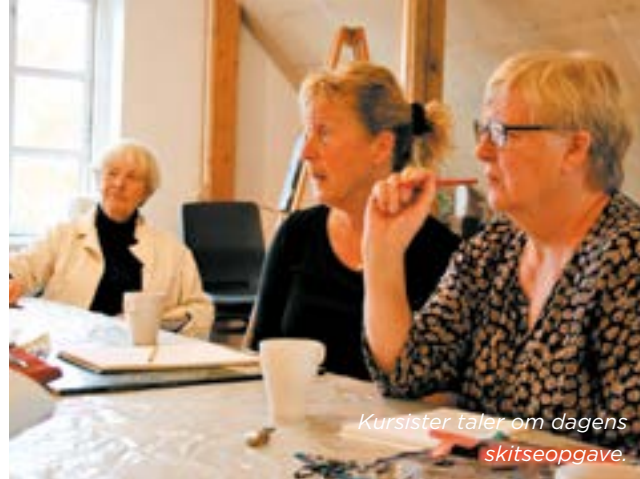
Kursister taler om dagens skitseopgave.