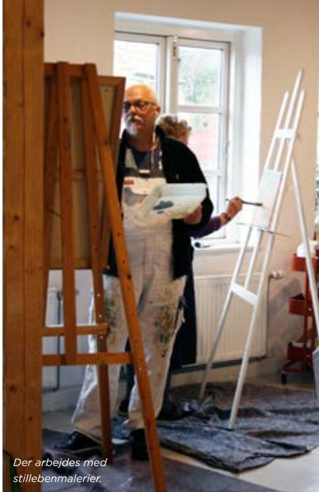
Der arbejdes med stillebenmalerier.