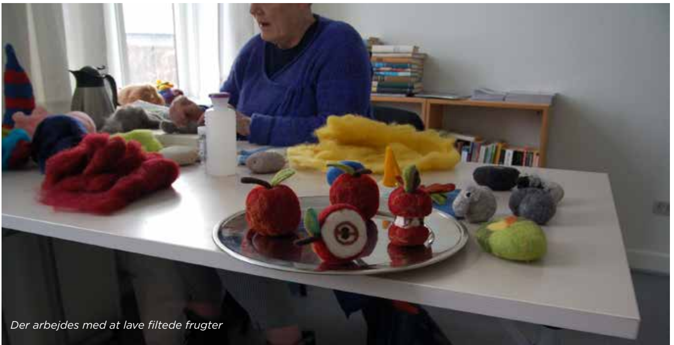
Der arbejdes med at lave fildede frugter