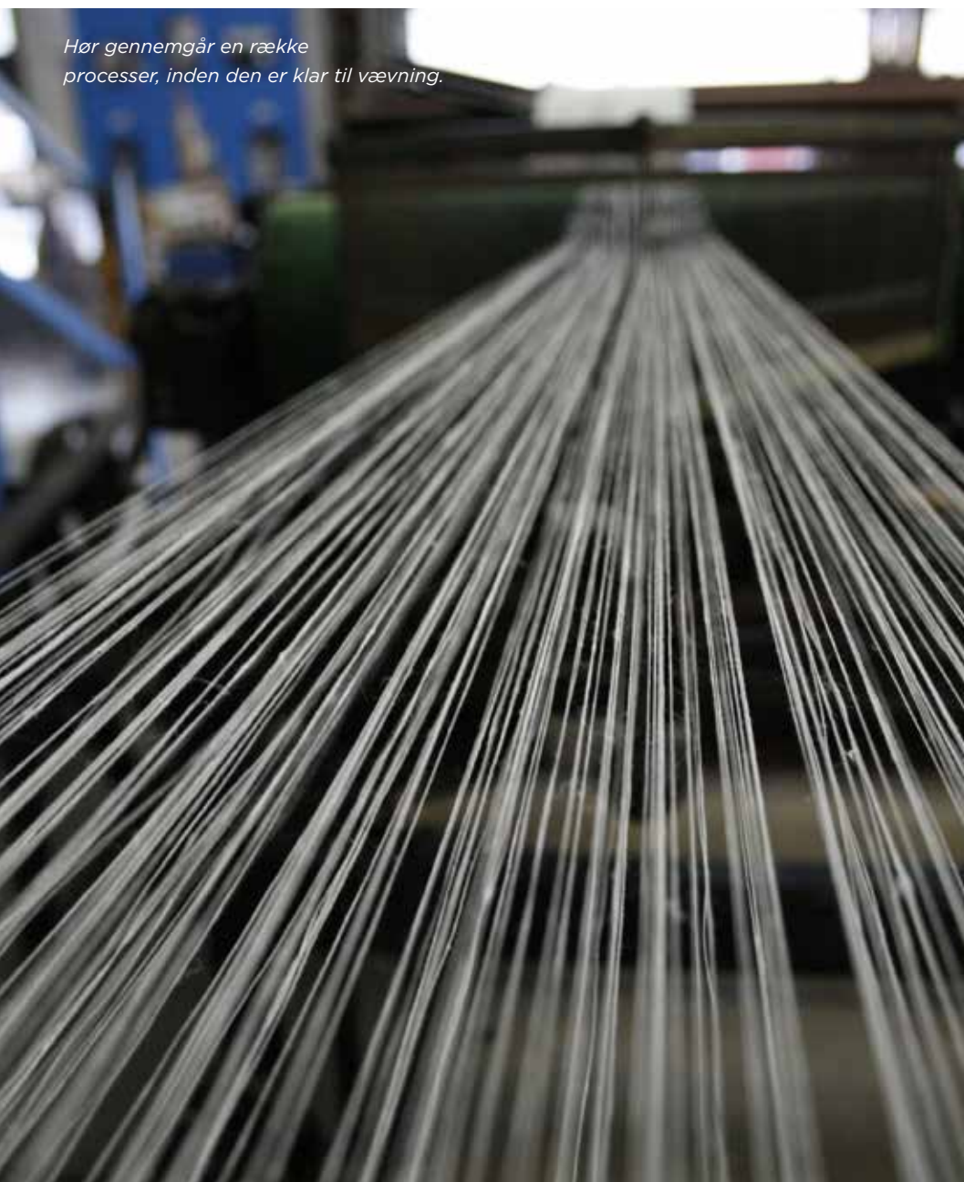
Hør gennemgår en række processer, inden den er klar til vævning.