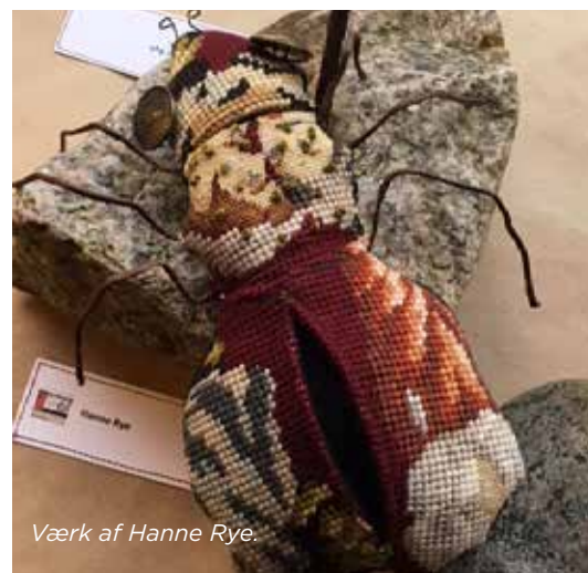
Værk af Hanne Rye.