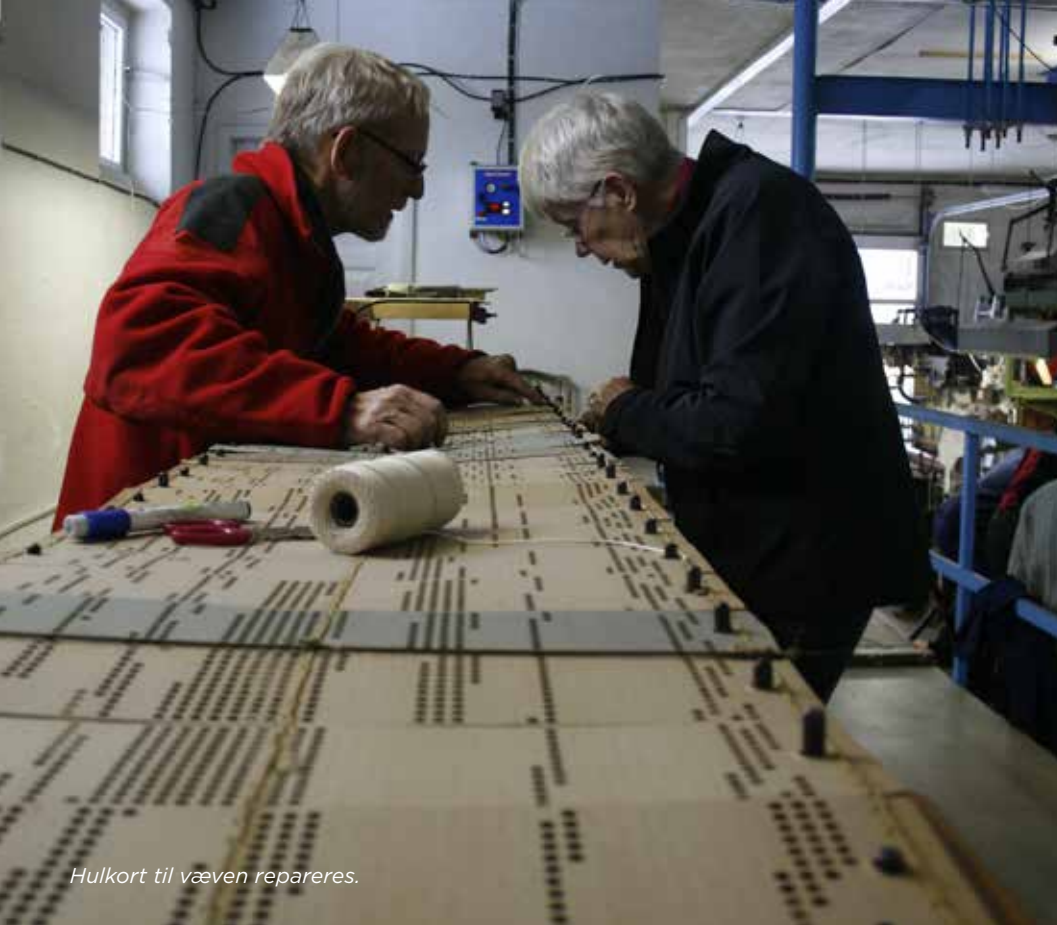
Hulkort til væven repareres.