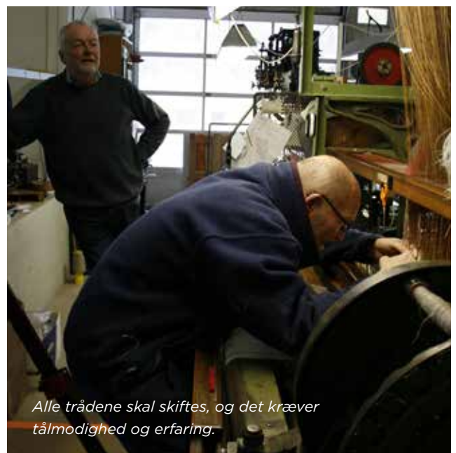
Alle trådene skal skiftes, og det kræver tålmodighed og erfaring.

ikke bange for, at der ikke vil være nogen til at føre foretagendet videre.