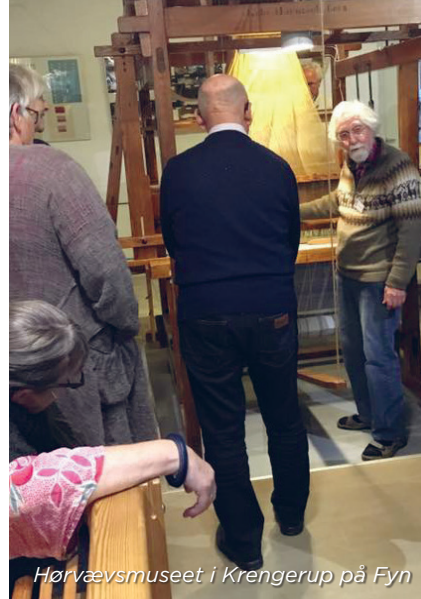
Hørvævmuseet i Krengerup på Fyn

Se fotos fra fyraftensmøderne på Foras Facebook-side ( www.facebook.com/forafolkeoplysning ) under "billeder".