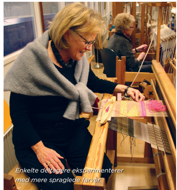
Enkelte deltagere eksperimenterer med mere spraglede farver