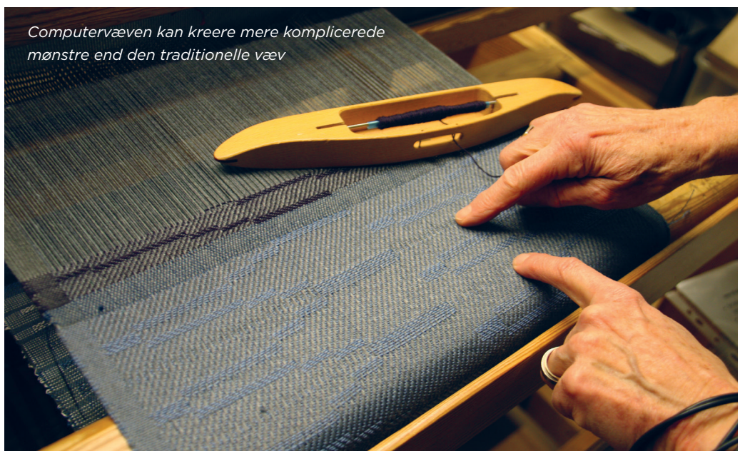
Computervæven kan kreere mere komplicerede mønstre end den traditionelle væv