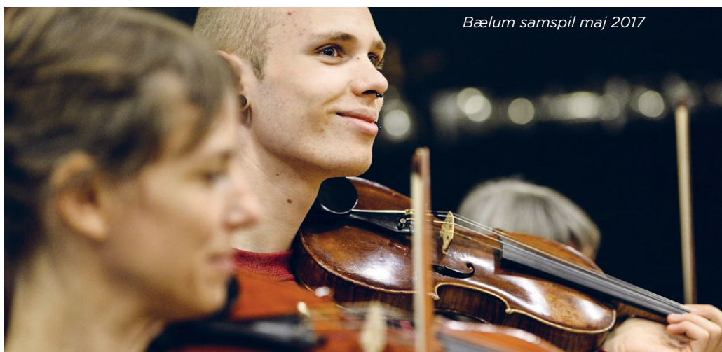
Bælum samspil maj 2017