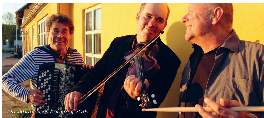
Musikbutikkens hold, maj 2016

Men vi kommer også i andre dele af Danmark, når vi holder "Musikalsk Åbent Hus". Her er alle inviteret til at spille med, synge eller give et par numre. Vores egne musikere er tovholdere, der spiller med, når det ønskes. Og det ønskes tit, for det er en stor fornøjelse at høre dem folde sig ud sammen med nye medspillere. Disse arrangementer organiserer vi sammen med lokale samarbejdspartnere, og støttes af bl.a. Saugman Bjerregårds Fonden og Statens Kunstfond, fordi de på enestående vis bringer musikken til folk, som ellers ikke vil komme i kontakt med levende kvalitetsmusik. ■