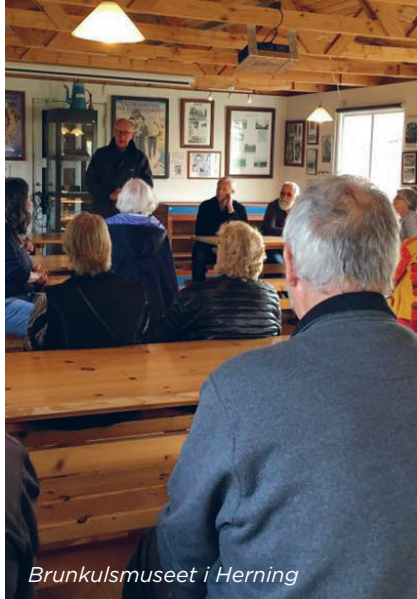
Brunkulsmuseet i Herning

Læs mere om at gøre sig mere synlig i artiklen "Skriv det rette til de rigtige" (side 16-17)