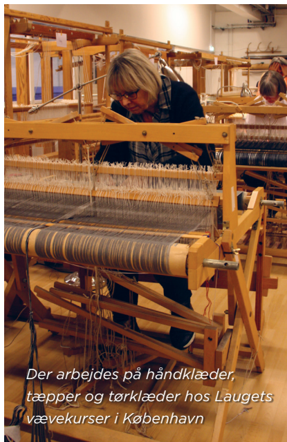
Der arbejdes på håndklæder, tæpper og tørklæder hos Laugets vævekursus i København