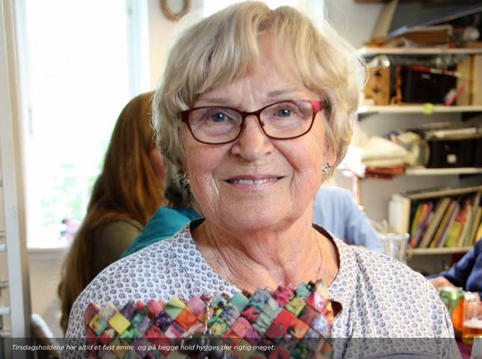
Tirsdagsholdene har altid et fast emne, og på begge hold hygges der rigtig meget.