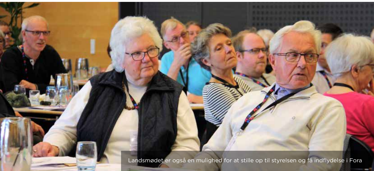
Landsmødet er også en mulighed for at stille op til styrelsen og få indflydelse i Fora