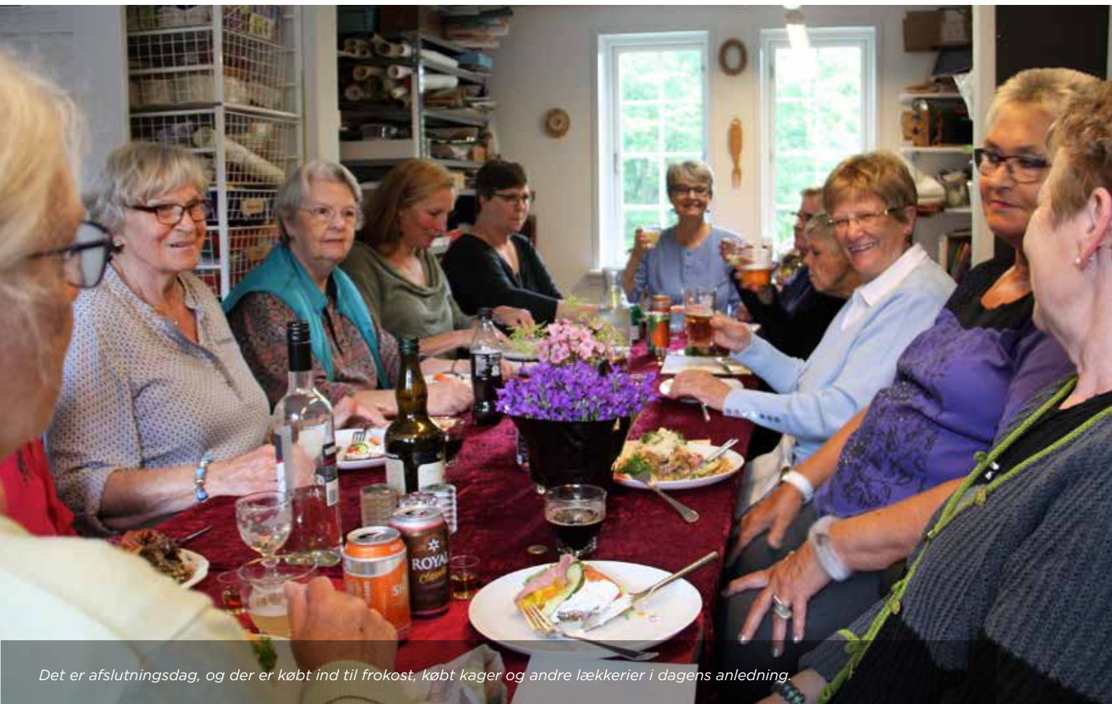
Det er afslutningsdag, og der er købt ind til frokost, købt kager og andre lækkerier i dagens anledning.

Det koster 125 kr. at være med i Snekkersten Husflid og deltagelse i aktiviteter koster 10 kr. pr. gang. De 10 kr. dækker el og vand. Så er der også gratis kaffe på kanden. Går man på kurserne, er der selvfølgelig deltagerbetaling som på alle andre aftenskoler.