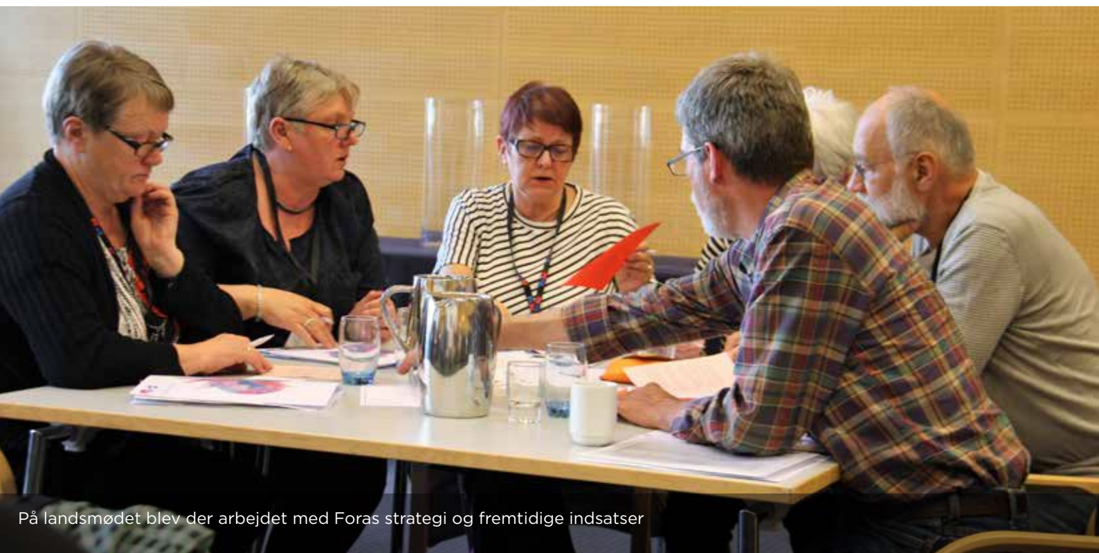
På landsmødet blev der arbejdet med Foras strategi og fremtidige indsatser