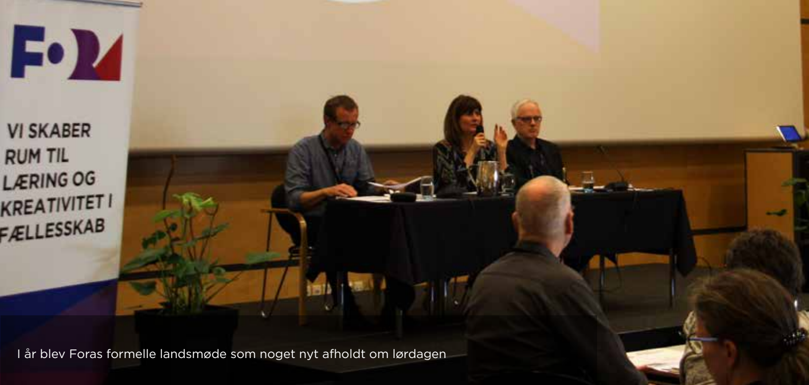
I år blev Foras formelle landsmøde som noget nyt afholdt om lørdagen