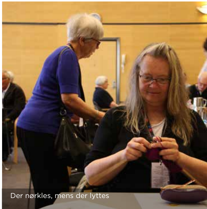
Der nørkles, mens der lyttes