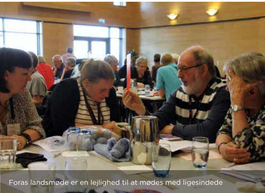
Foras landsmøde er en lejlighed til at mødes med ligesindede