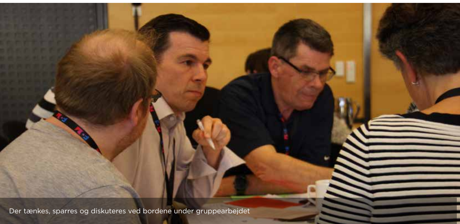
Der tænkes, spares og diskuteres ved bordene under gruppearbejdet