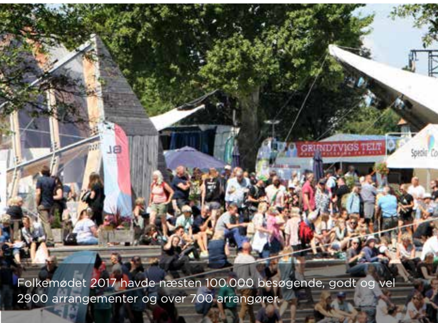
Folkemødet 2017 havde næsten 100.000 besøgende, godt og vel 2900 arrangementer og over 700 arrangører.