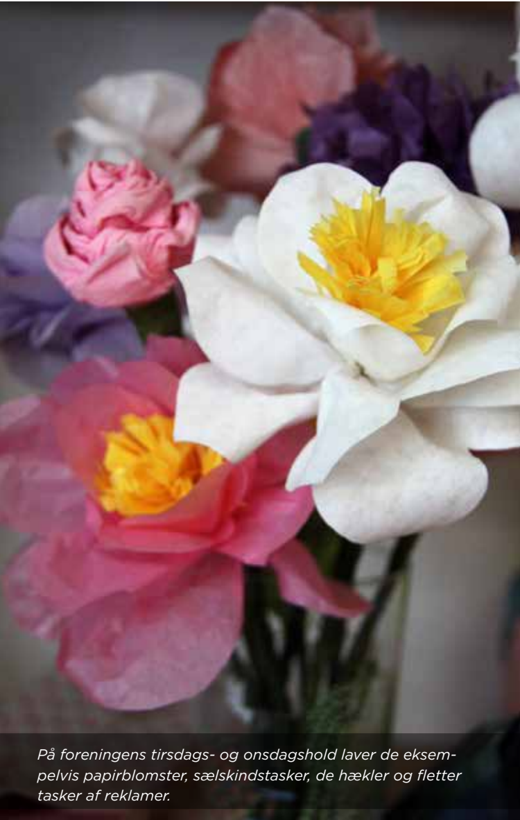
På foreningens tirsdags- og onsdagshold laver de eksempelvis papirblomster, sælskindstasker, de hækler og fletter tasker af reklamer.