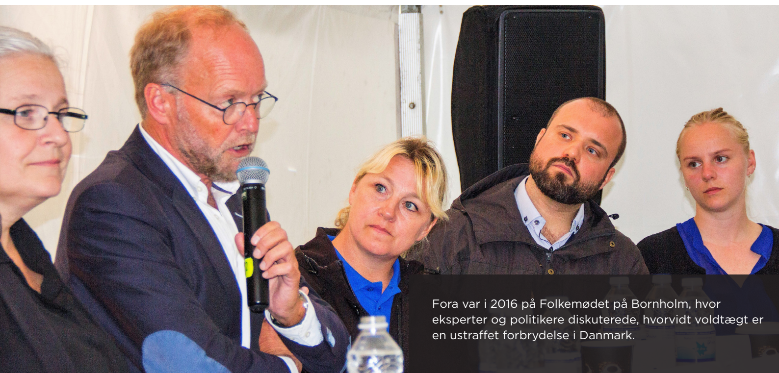
Fora var i 2016 på Folkemødet på Bornholm, hvor eksperter og politikere diskuterede, hvorvidt voldtægt er en ustraffet forbrydelse i Danmark.