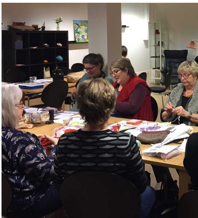
Den første medlemsaften i de nye lokaler (nederst th.).