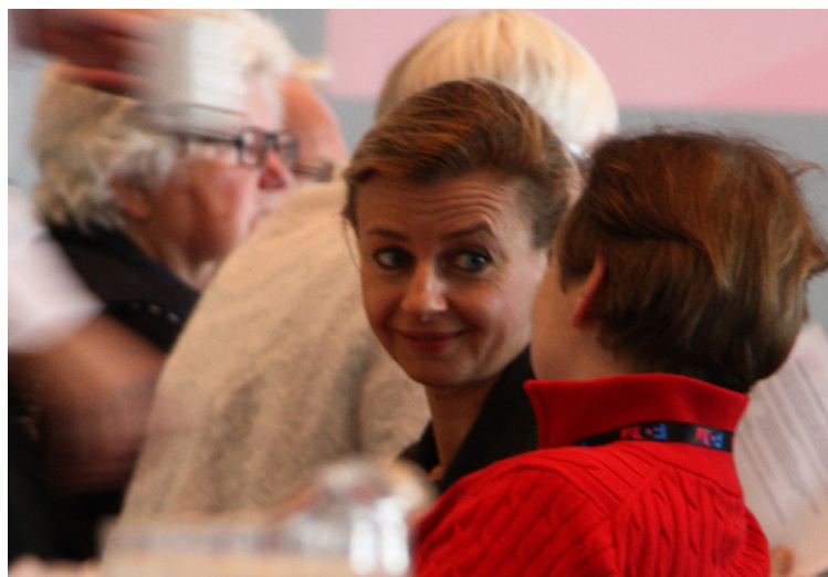
Dette års landsmøde blev afholdt i Vejle. I år er vi tilbage i Svendborg.