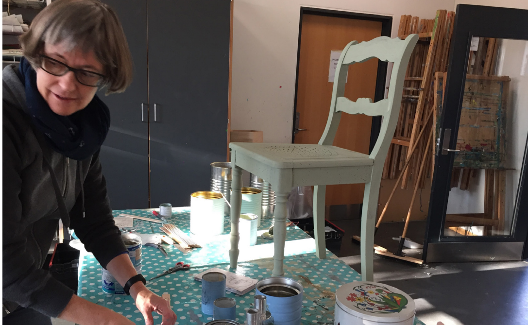
Et populært kursus hos Kreativ Fritid Juelsminde var sidste år kalkmaling (øverst og nederst th.)