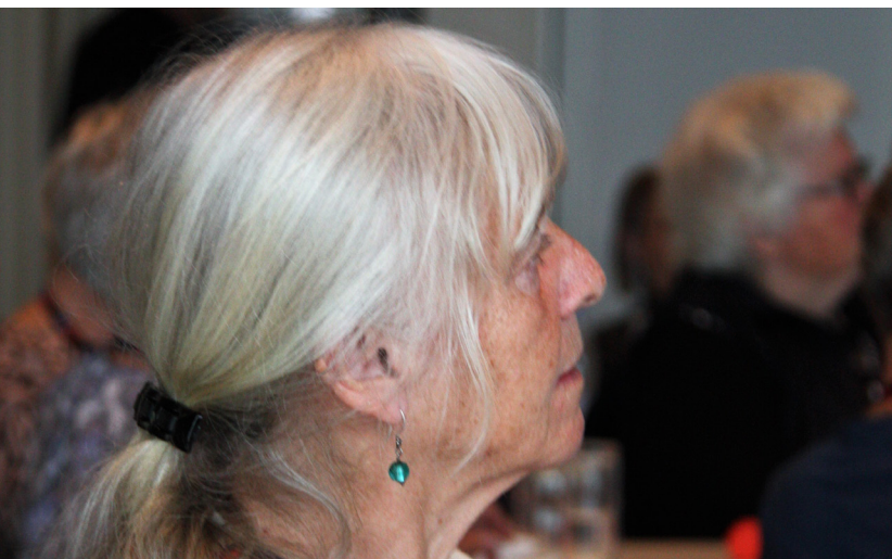
På landsmødet blev der afholdt workshops i blandt andet Facebook, i brug af den lokale presse, i bestyrelsesarbejde, i brug af nyhedsbreve m.v.