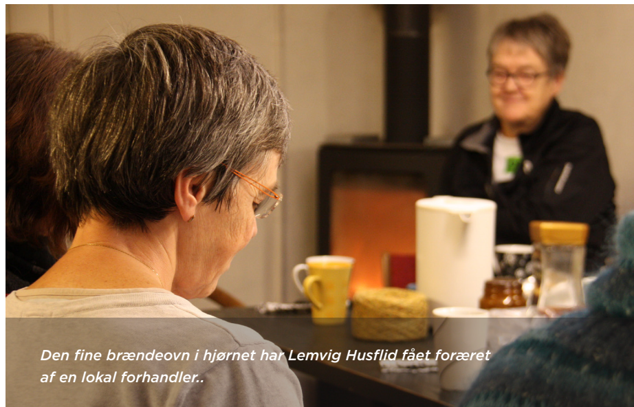
Den fine brændeovn i hjørnet har Lemvig Husflid fået foræret af en lokal forhandler..