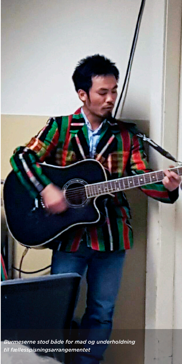
Burmeserne stod både for mad og underholdning til fællesspisningsarrangementet