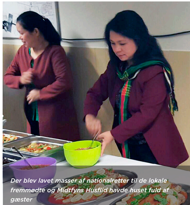
Der blev lavet masser af nationalretter til de lokale fremmødte og Midtfnys Husflid havde huset fuld af gæster

udgaver: Den stærke marinade-dyppelse stod i små skåle ved siden af, og til nogles store overraskelse var den virkelig stærk! Det lignede en slags ketchup eller chutney, men det skulle man ikke lade sig snyde af!