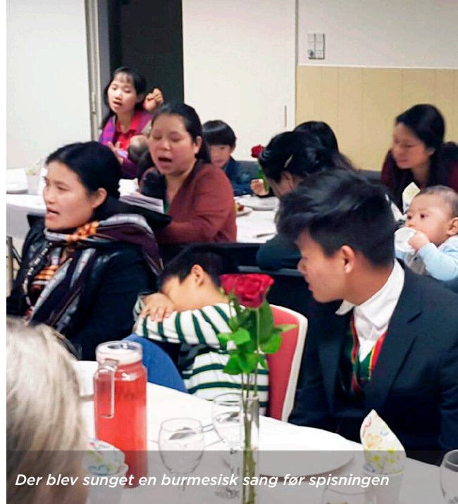
Der blev sunget en burmesisk sang før spisningen