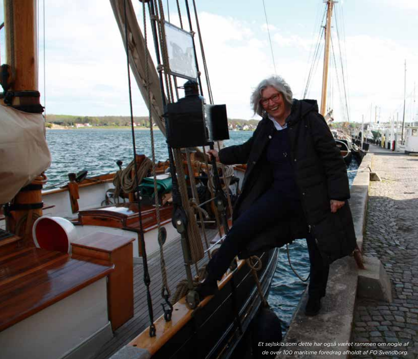
Et sejskib som dette har også været rammen om nogle af de over 100 maritime foredrag afholdt af FO Svendborg.