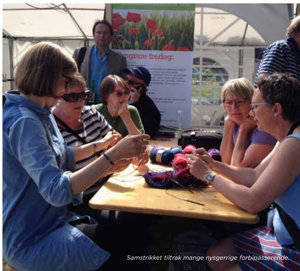
Samstrikket tiltrak mange nysgerrige forbigående.