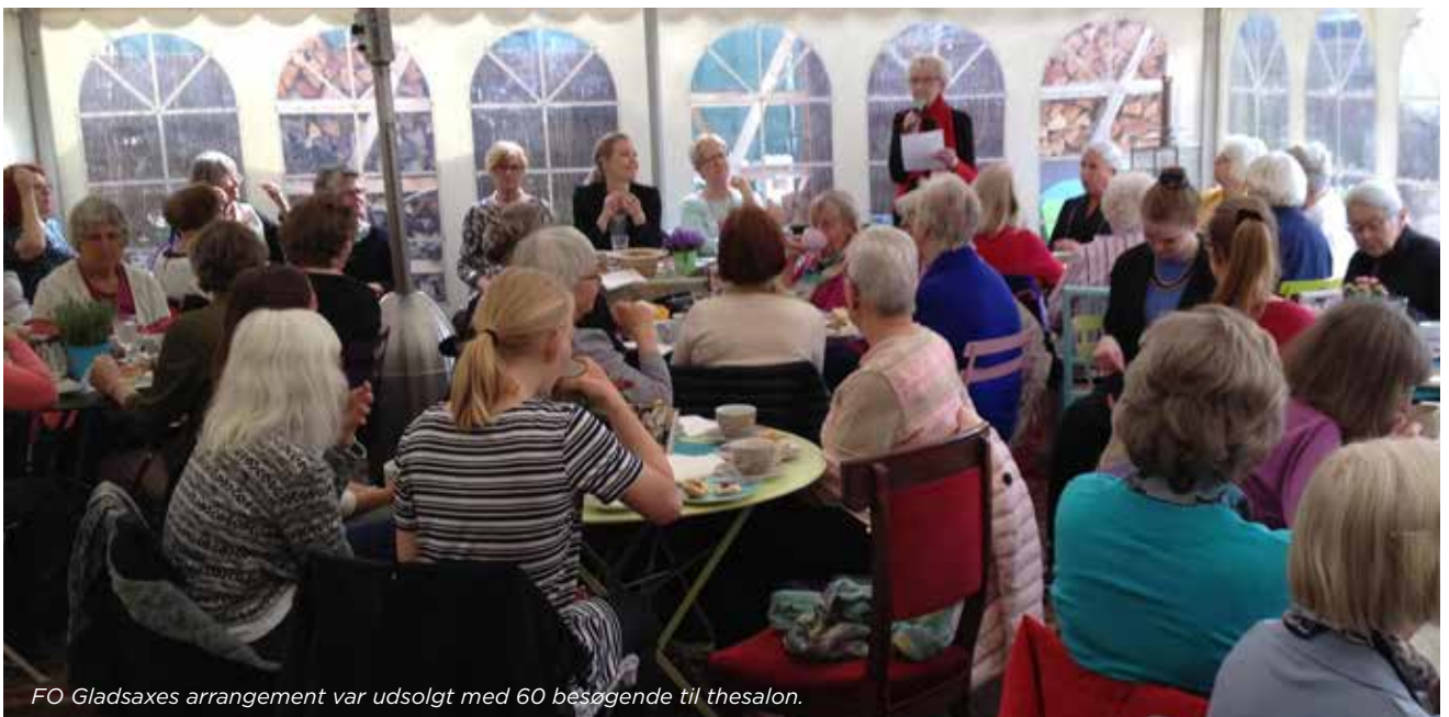
FO Gladsaxes arrangement var udsolgt med 60 besøgende til thesalon.