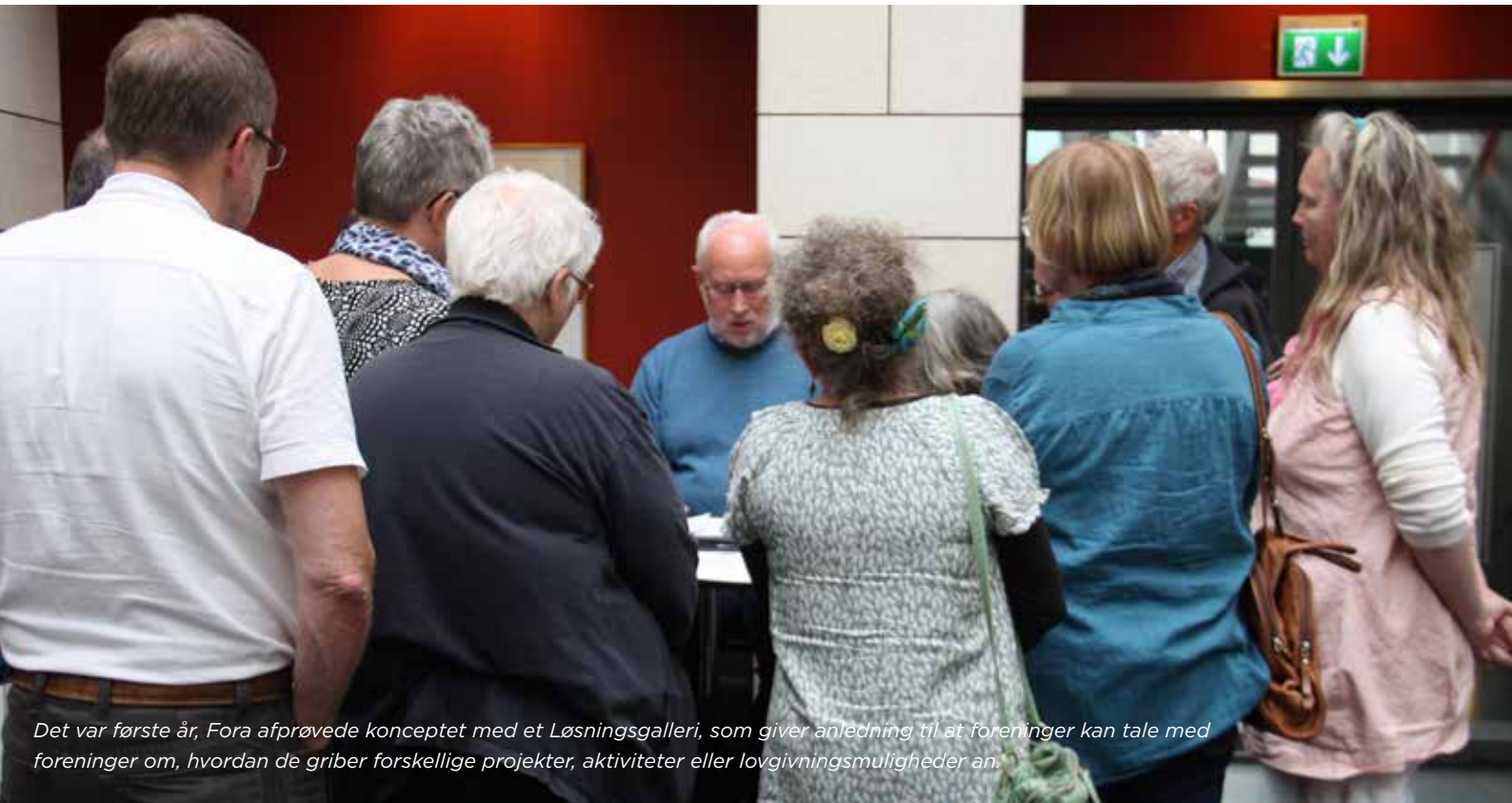
Det var første år, Fora afprøvede konceptet med et Løsningsgalleri, som giver anledning til at foreninger kan tale med foreninger om, hvordan de griber forskellige projekter, aktiviteter eller lovgivningsmuligheder an.